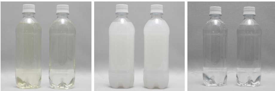
清涼飲料水 洗濯用合成洗剤 清涼飲料水 洗濯用合成洗剤 清涼飲料水 消毒液