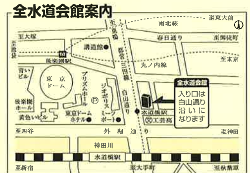
JR水道橋駅 東口(お茶の水寄り)下車2分 都営地下鉄三田線水道橋駅 A1出口1分 ※一般社団法人 全水道会館 TEL03-3816-4196 https://www.mizujoho.com

JR水道橋駅 東口 徒歩2分 都営地下鉄 三田線 水道橋駅 A1 出口 徒歩1分